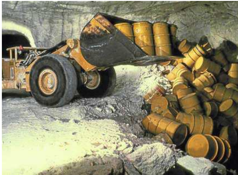
Abb. 33 Lagerung von Stahlfässern mit radioaktiven Abfällen in das Salzbergwerk Asse II (Wolfenbüttel/Niedersachsen)

Mehrzahl dieser Fässer wurde nicht ordnungsgemäß erfasst, so dass ihr genauer Inhalt nicht bekannt ist. Den Inhalt an Plutonium in diesen Fässern schätzt man auf insgesamt ca. 28 \cdot kg . Heute wird an einem Rückholungskonzept für diese Abfälle gearbeitet. Die Behörden veranschlagen die dafür erforderlichen Kosten auf 2 \cdot 10^9 \cdot Euro , andere Experten veranschlagen bis zu 6 \cdot 10^9 \cdot Euro .