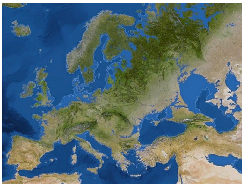
Abb. 39 Geographische Karte von Europa, Nordafrika und West-Asien mit Markierung der von Überflutung bedrohten Landflächen

eine Reihe von Prozessen, die diesen Vorgang einleiten, bereits in vollem Gang sind, s. z.B. [60].